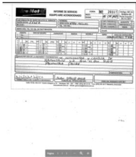
Figura 1. Soporte cambio display por airenet