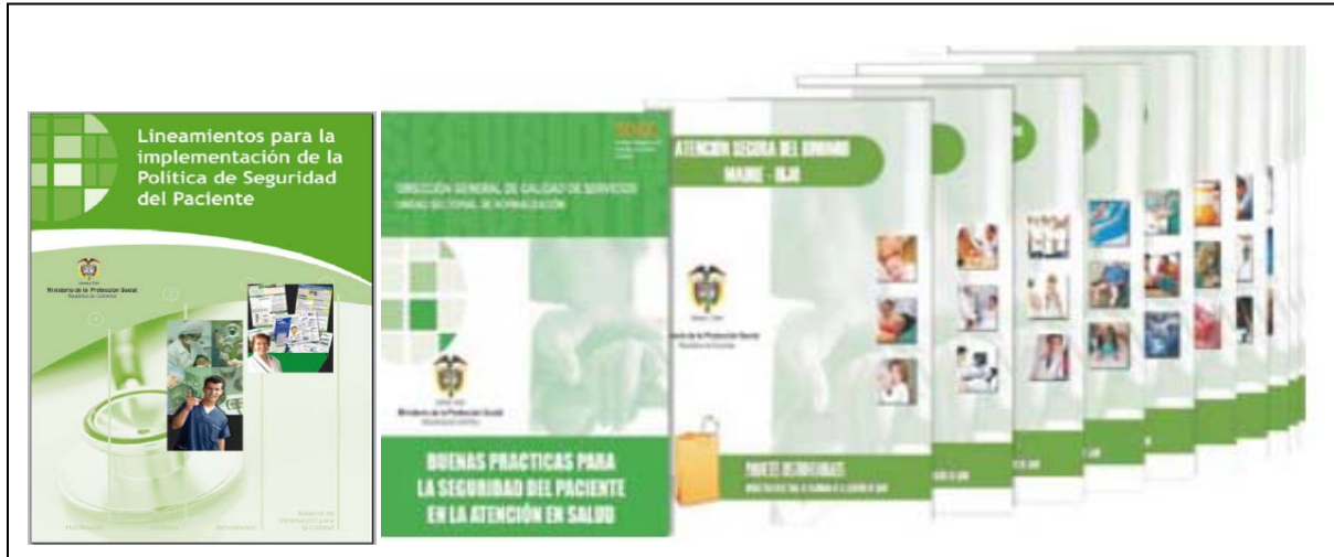
Ilustración 2: documentos publicados que soportan las recomendaciones contenidas en la guía técnica: "Buenas Prácticas para la Seguridad del Paciente en la Atención en Salud"

Para efectos de esta guía, el modelo conceptual y las definiciones son los establecidos por los "Lineamientos para la implementación de la Política de Seguridad del Paciente" expedidos por el Ministerio de la Protección Social de Colombia.