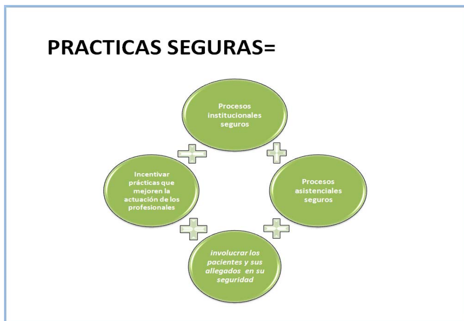
Ilustración 1: Conceptualización gráfica de la Guía Técnica de Buenas Prácticas para la Seguridad del paciente.

Las buenas prácticas contenidas en esta Guía Técnica en Salud son aplicables a: